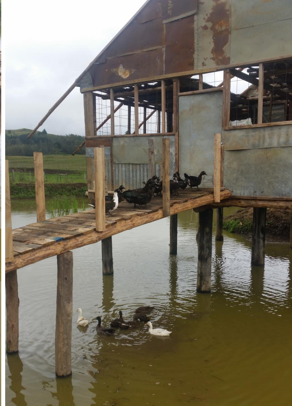
1100 Tilapia vissen en 30 eenden in de vijver